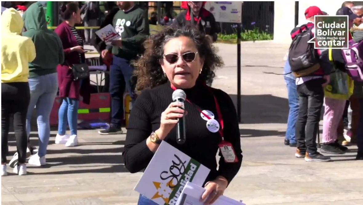
Segundo momento: Feria Ciudad Bolívar territorio que reverdece y movilidad sostenible.