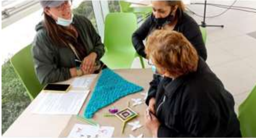
Mesa 4: Bogotá Región un modelo de movilidad, creatividad y productividad incluyente y sostenible.

Se realizó apertura de la mesa de trabajo del dialogo ciudadano, en compañía de comunidad de ciudad Bolívar de la comunidad LBGTI y de instancias de participación local.